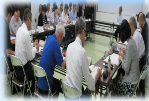
5/15 川薩地区在宅医療推進会議

各会議では、前年度の振り返りや今年度の活動計画について話し合いました。今年度は、ACPIに関する研修会の開催に向けて、これからも話し合いを進めてまいります。また、医療機関等を対象とした「在宅医療提供状況調査」も、前年度同様の8月に調査を行うことが決定しました。みなさまご協力よろしくお願いたします。