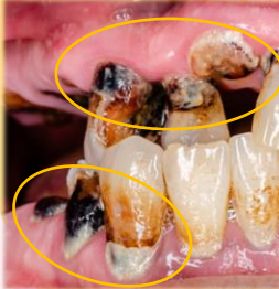
〈根面う蝕の写真〉

根面う蝕は一度に複数の歯にできることも多く、歯の首部分がぐるりと溶けてしまうためある日突然ぱきと折れて抜歯になり、入れ歯を入れるしか手立てがないこともあります。